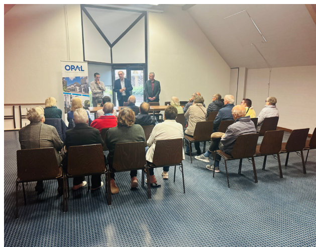
L'OPAL a accueilli une vingtaine de locataires pour trouver des solutions durables.

La proximité avec les habitants est au cœur de la mission de service public de l'OPAL. Elle permet de créer un lien de confiance avec les locataires tout en renforçant la dynamique collective au sein des quartiers.