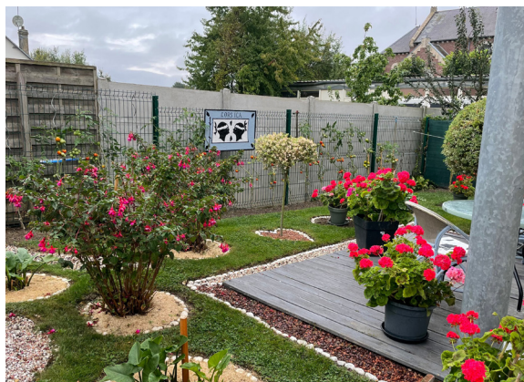
Il aura fallu 5 ans de travail à Jean-Claude pour réaliser ces aménagements.