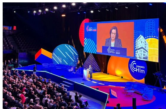
Durant la séance officielle d'ouverture, Emmanuelle Cosse, Présidente de l'USH a pris la parole.