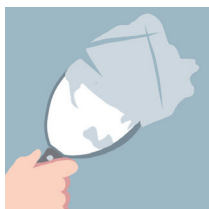
Dans certains enduits plâtre