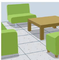
Dans certains revêtements de sols en dalles